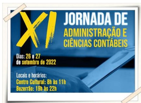
Cartazes de divulgação da Jornada de Administração e Ciências Contábeis

Descrição: A XI Jornada da Administração e Ciências Contábeis é um evento acadêmico promovido pela coordenação. O evento visa estabelecer a relação entre o ensino teórico e a prática da administração e contabilidade.