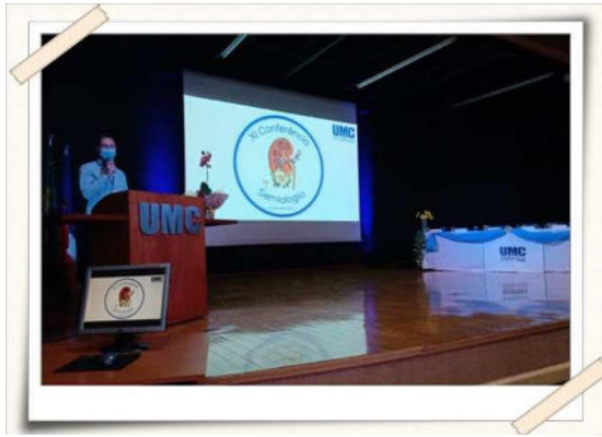
Registro do evento – Anfiteatro UMC