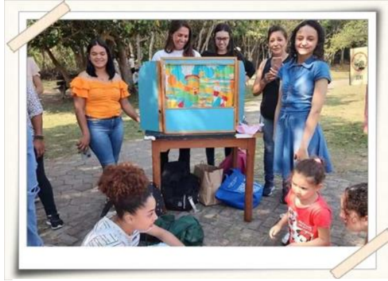
Registro da atividade lúdica – parque centenário