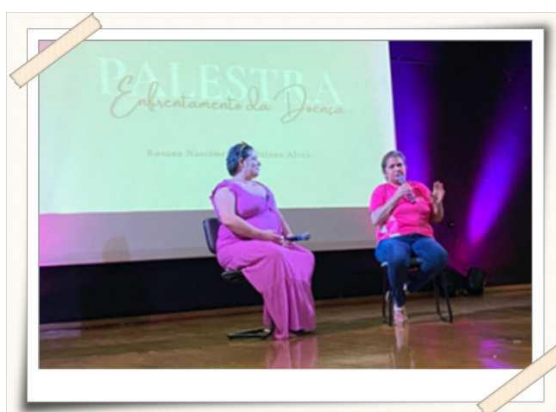
Registro da roda de conversa com pacientes que compartilharam suas experiências – Teatro UMC