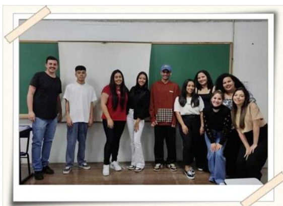
Registro dos alunos

Estimular a educação empreendedora, buscar o envolvimento dos Cursos de Gestão da Qualidade, Recursos Humanos, Marketing, Logística, Publicidade e Propaganda e Comunicação e Marketing, da UMC no tema Empreendedorismo; promover nos estudantes habilidades e competência de liderança, mentoria, gestão e solução de problemas e engajar uma nova geração empreendedora, além de contribuir positivamente para impacto social econômico.