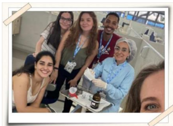
Registro dos alunos UMC e profissionais da área – Clínica Odontológica

Descrição: A Jornada Odontológica da UMC tem como objetivo possibilitar aos acadêmicos aprimorar e atualizar conhecimentos em diversas áreas de atuação do odontólogo, permitindo ainda integração e a troca de experiência.