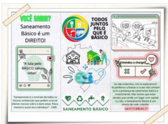
Folheto desenvolvido pelos alunos

Após conclusão da 1ª etapa, os alunos serão submetidos à 2ª etapa, que ocorrerá no primeiro semestre de 2023, quando, em uma ação de orientação, apresentarão à comunidade, por meio de cartilhas/folhetos de maneira geral, possibilitando qualidade de vida ao público assistido.