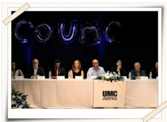
Registro dos professores UMC e convidados – Teatro UMC

Descrição: O Congresso Odontológico da UMC é um evento tradicional onde são realizados no período da manhã, tarde e noite, minicursos, mesas redondas sobre temas atuais em Odontologia e Hands-on , nos quais os alunos participam de atividades práticas de manipulação de equipamentos e materiais atuais.