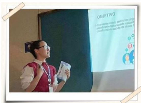
Registro da apresentação – sala de aula

Descrição: Para a Jornada Odontológica da UMC os alunos desenvolveram pesquisa científica, sob orientação de professores do curso submeteram resumos para avaliação da Comissão Científica, composta por professores internos que, após análise, selecionaram os trabalhos aprovados para apresentação no evento. As apresentações ocorreram em salas abertas ao público em geral, com banca composta por dois avaliadores externos. Após a apresentação o aluno respondeu a arguição da banca avaliadora. Os melhores trabalhos foram premiados em cerimônia.