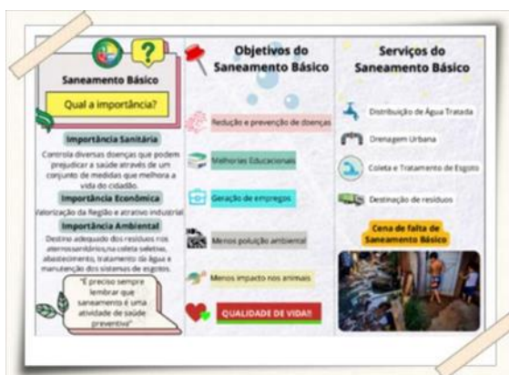
Folheto desenvolvido pelos alunos