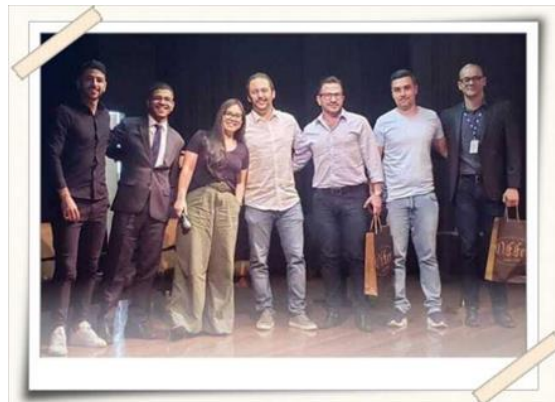
Registro da equipe Acreditar Banco e professores UMC