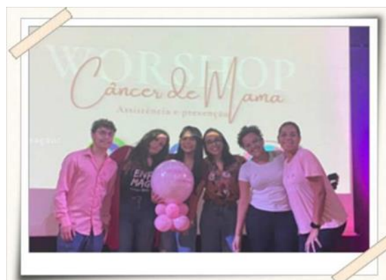
Registro da equipe organizadora

Cada membro ficou responsável por uma tarefa, entre elas: contato com possíveis parceiros, elaboração das artes e divulgação, compra dos materiais, compra dos alimentos para o coffee break, coordenação do projeto, contato com os convidados e palestrantes.