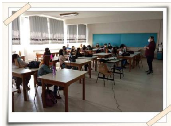
Registro dos alunos – aula prática