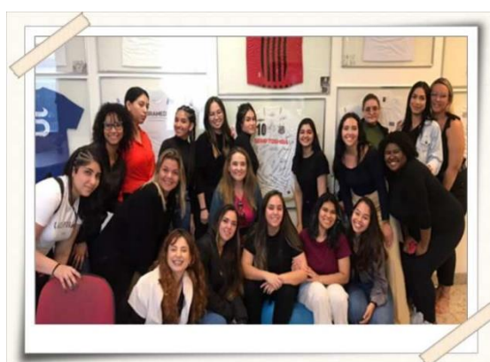
Registro dos alunos – visita técnica: IBRAMED