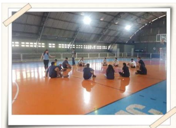
Registro da atividade prática - centro esportivo UMC

No segundo dia, os alunos foram orientados a montar suas atividades com base na teoria e prática do primeiro dia. Para finalizar, os participantes colocaram em práticas as atividades. A capacitação foi finalizada com uma roda de conversa pontuando pontos fortes e pontos a serem melhorados.