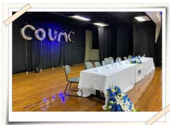
Registro do espaço organizado pelos alunos – Teatro UMC

Descrição: Os alunos do curso de Odontologia realizaram o planejamento, organização, confecção de material, divulgação e participação na organização durante o evento. A Comissão Organizadora do Congresso Odontológico da UMC participou, realizando eventos pré-congresso, como: minicursos e palestras. Também, eventos para recebimento e doação de kits de higiene para a realização de atividades educativas para a comunidade.