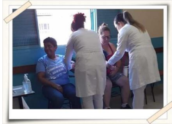
Registro dos alunos aferindo a pressão arterial – bairro Jardim Universo