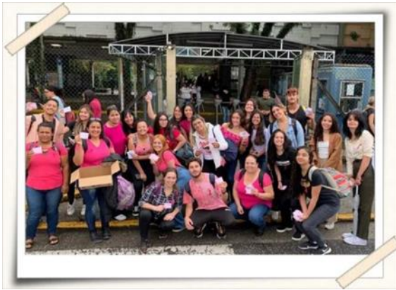
Registro dos alunos UMC