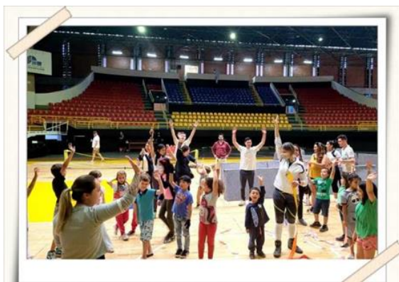
Registro dos alunos – ação no ginásio municipal

O evento em comemoração aos 462 da cidade de Mogi das Cruzes propôs vivências esportivas para crianças nas modalidades de ginástica rítmica, futebol, basquete e tênis com bexiga. A ação foi possibilitada pela Secretaria Municipal de Esporte e Lazer de Mogi das Cruzes, e cooperação dos alunos do curso de Educação Física da UMC.