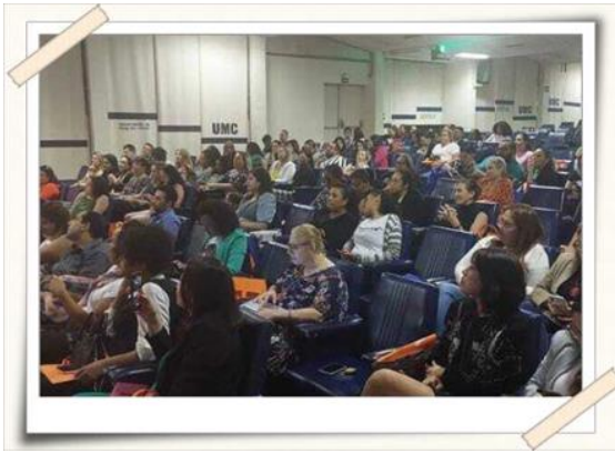
Registro dos alunos – Teatro UMC