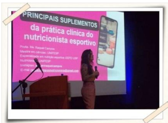
Registro da palestrante