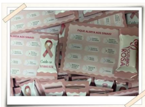
Registro dos kits