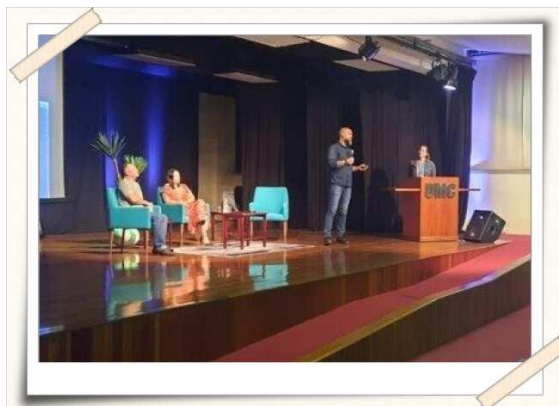
Registro dos palestrantes convidados – Teatro UMC