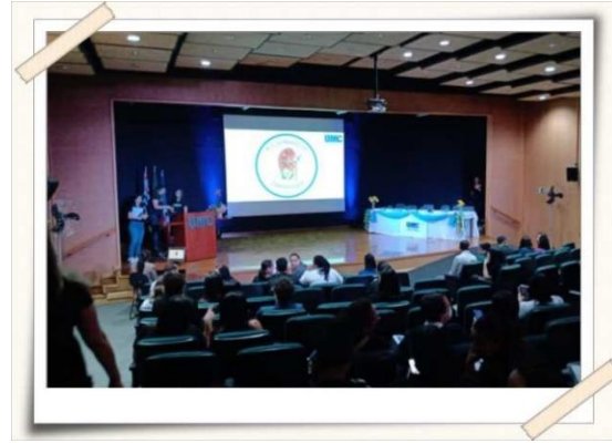
Registro do evento – Anfiteatro UMC