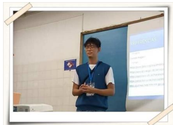
Registro da apresentação – sala de aula