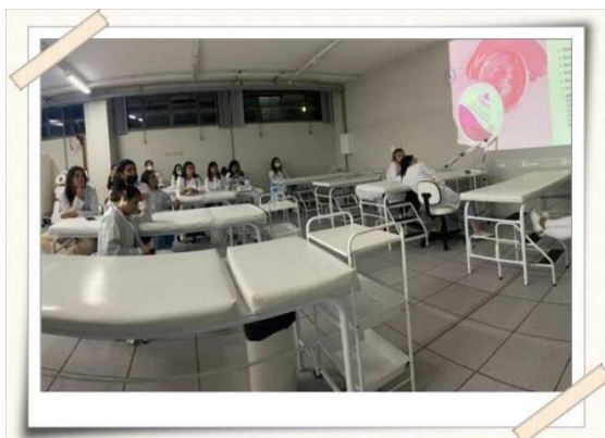
Registro da aula teórica – Laboratório de Estética

No dia 25/11, no laboratório de estética, uma aula prática sobre o protocolo de higienização facial e hidratação.