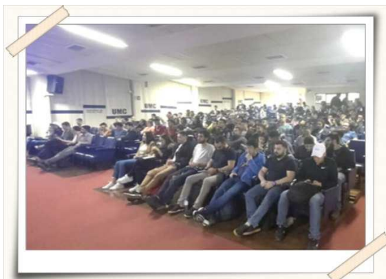
Registro dos alunos – Teatro UMC

entender qual a importância de sua utilização em seus programas de controle e gestão.