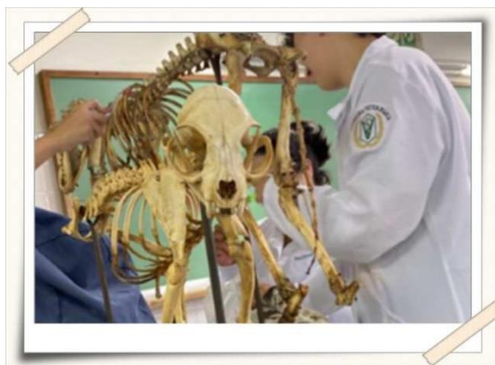
Registro dos alunos dissecando as peças – laboratório de anatomia veterinária