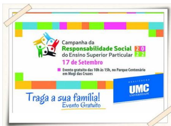
Cartaz de divulgação desenvolvido pelos alunos

Descrição: Os alunos do curso de Design Gráfico desenvolveram e realizaram a produção gráfica dos materiais para a campanha do Dia Nacional da Responsabilidade Social 2022 (cartaz, programação e material para os cursos entre outros).