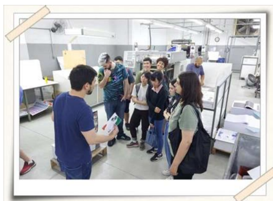
Registro dos alunos – visita técnica: gráfica MURC