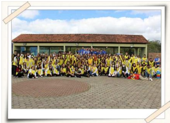
Registro dos alunos, professores e técnicos – Parque Centenário

Os alunos circularam por todo o evento fotografando os visitantes e atendimentos oferecidos.