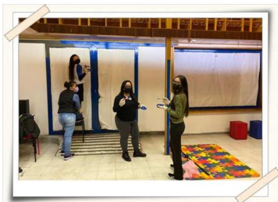
Registro dos alunos montando o espaço da brinquedoteca