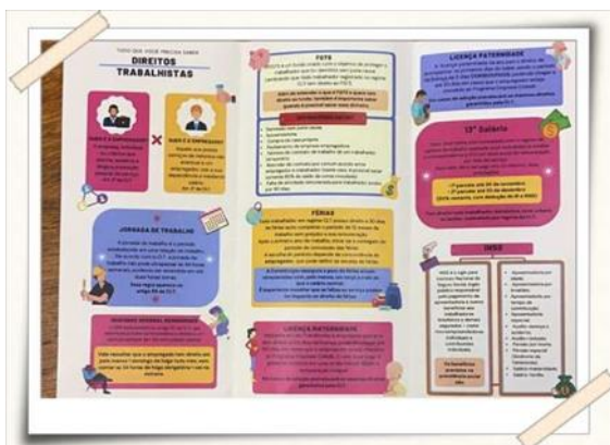
Folheto desenvolvido pelos alunos

A ação foi realizada em 01/12, na Estação Estudantes da CPTM e no Hipermercado D'avó, em Mogi das Cruzes, com supervisão docente.