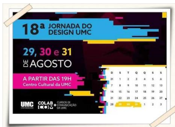
Cartaz de divulgação da 18ª jornada Design