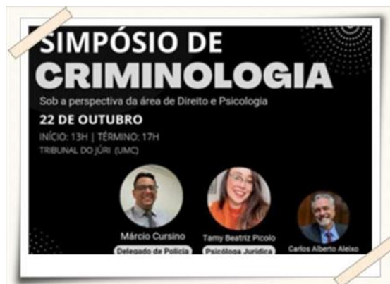
Cartazes de divulgação do Simpósio de Criminologia