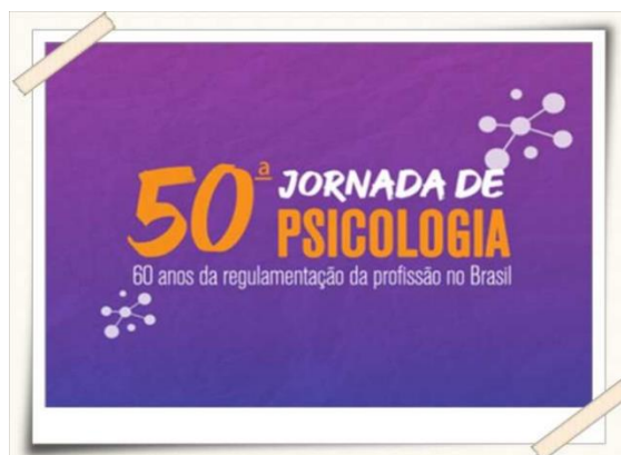
Cartaz de divulgação da 50ª jornada de Psicologia

A jornada abordou temas relevantes como: As contribuições da Psicologia e as possibilidades de atuação nas políticas de atendimento às mulheres em situação de violência, Saúde Mental em tempos de crise: os desafios da Psicologia na Rede de Atenção Psicossocial e O Sistema de Garantias de Direitos de Crianças e Adolescentes e o trabalho do psicólogo.