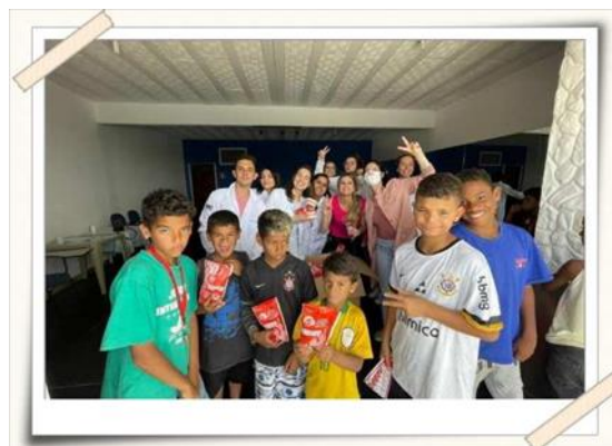
Registro das crianças com os kits de higiene – bairro Novo Horizonte