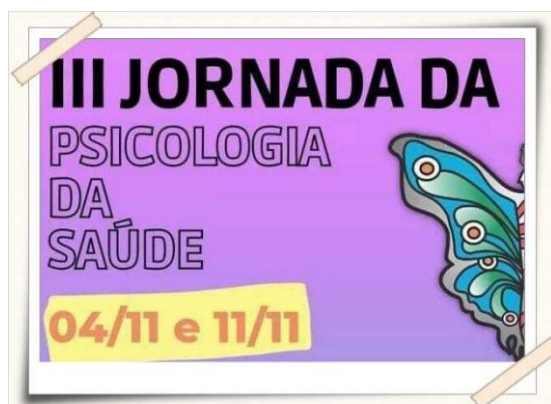
Cartaz de divulgação da Jornada da Psicologia