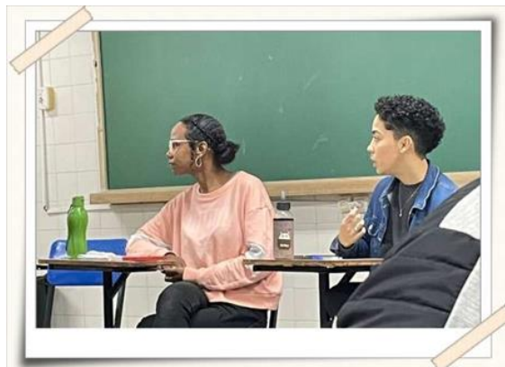
Registro dos encontros – sala de aula

Os encontros ocorreram, às quartas-feiras das 18h às 19h, totalizando onze encontros.