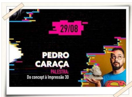
Cartaz de divulgação desenvolvido pelos alunos