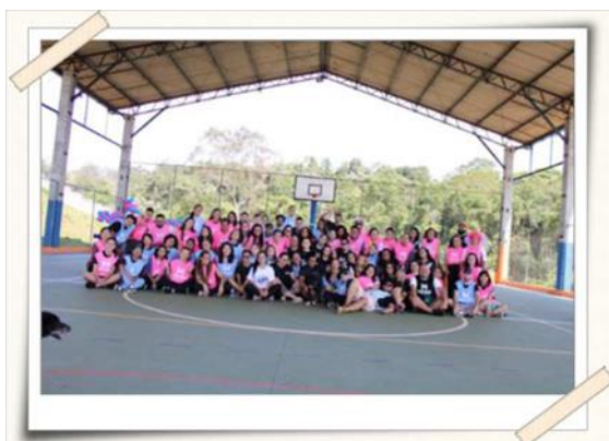
Registro dos alunos (UMC) e comunidade do conjunto Jefferson

e adolescentes, seja monitorando, brincando, supervisionando, auxiliando em diversas tarefas, estimulando a sociabilização e interação ou suportando materialmente, com doações de doces e apoio financeiro.