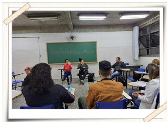
Registro dos encontros – sala de aula

Os encontros ocorreram, às terças-feiras das 18h às 19h, totalizando onze encontros.