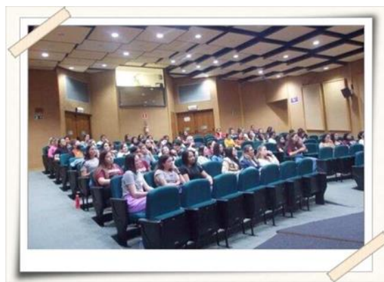
Registro dos alunos – anfiteatro UMC