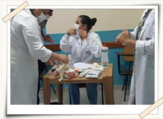
Registro dos alunos preparando o espaço - Igreja Católica do bairro Jardim Universo