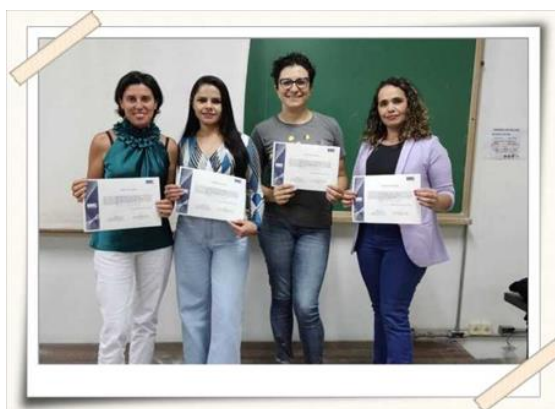
Registro das mulheres empreendedoras