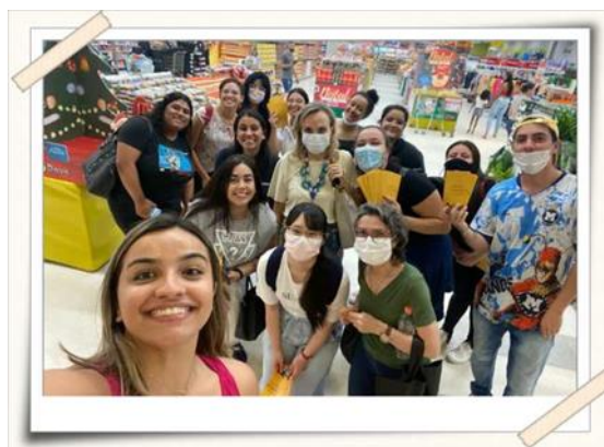
Registro dos alunos e professora – Hipermercado D'avó