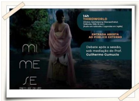
Cartazes de Divulgação do Mimese #82