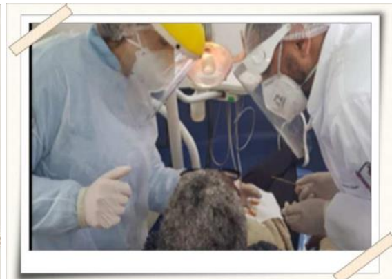
Registro dos alunos - avaliação bucal