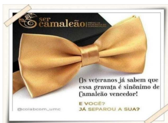
Cartaz de divulgação do evento Ser Camaleão

Descrição: Os alunos realizaram a produção, organização e apresentação da cerimônia do Ser Camaleão - Prêmio de Excelência em Comunicação que reconhece os melhores projetos dos cursos de Design Gráfico, Jornalismo, Publicidade e Propaganda e Comunicação e Marketing de 2022. Sob a orientação da coordenação dos Cursos de Comunicação, os alunos ficaram responsáveis pelas seguintes demandas: recepção do evento, apresentação do cerimonial, registro fotográfico, apresentação artística musical, edição de vídeo e apresentação do material editado e sua produção geral.