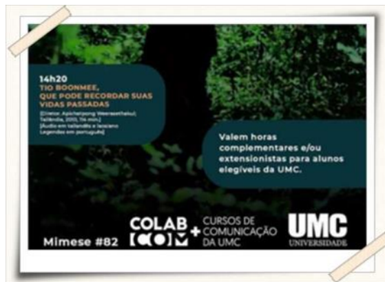
Cartazes de Divulgação do Mimese #82