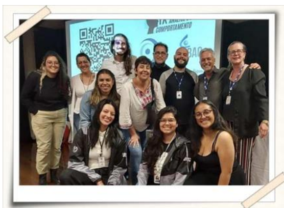
Registro dos alunos, professores e convidados

“O evento foi uma iniciativa da Liga Acadêmica de Análise do Comportamento (LAACMOGI) UMC e contou com a participação de convidados da área.