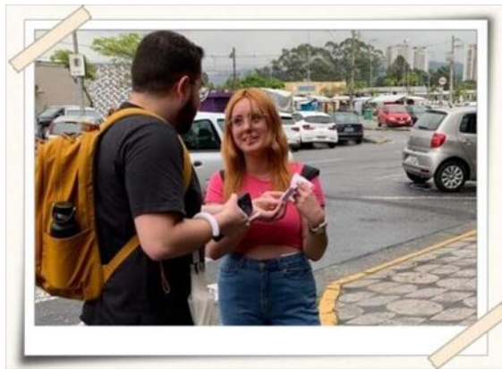
Registro da entrega do kit e orientação - Estação estudante da CPTM