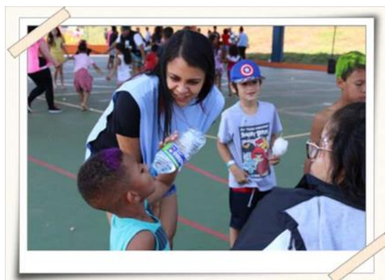
Registro da atividade lúdica – conjunto Jefferson