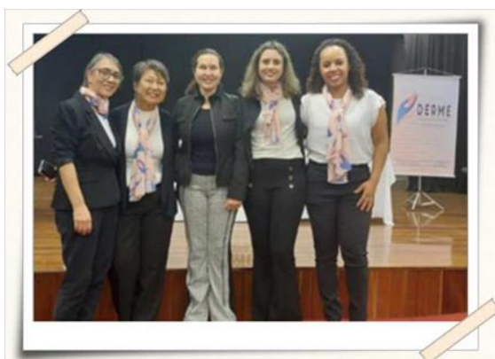
Registro da equipe organizadora

Descrição: Os Alunos do 5º A do curso de Enfermagem participaram da organização do encontro em parceria com a Derme Soluções & Consultoria, cuidando das inscrições, confirmando presença dos palestrantes, organizando o espaço do evento e auxiliando no dia do evento.