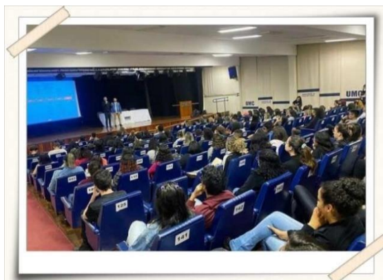
Registro dos alunos – Teatro UMC