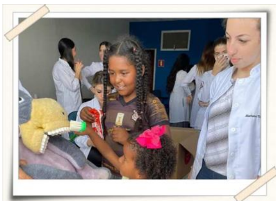
Registro dos alunos orientando as crianças sobre higiene bucal – bairro Novo Horizonte

Descrição: Realizada pelos alunos de Odontologia da Universidade de Mogi das Cruzes, no bairro Novo Horizonte, em Mogi das Cruzes, no dia 22/10/2022, período das 9h às 13h. O objetivo foi orientar as crianças sobre higiene oral, de uma maneira lúdica com macromodelo e escova para a orientação, após a ação foi entregue kits de higiene “escova infantil e pasta de dente”.