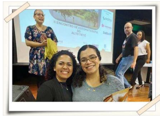
Registro dos palestrantes convidados