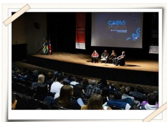
Registro dos alunos no encerramento do evento – teatro cenforpe