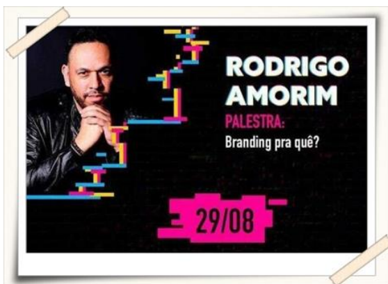
Cartaz de divulgação desenvolvido pelos alunos

Descrição: Os alunos do curso de Design Gráfico realizaram a organização/produção da Jornada, nas seguintes demandas: indicação e contato com os palestrantes, criação e desenvolvimento do material de divulgação do evento, busca e seleção de patrocinados/parceiros, cerimonial e recepção do evento, montagem da exposição de trabalhos e apresentação do evento.