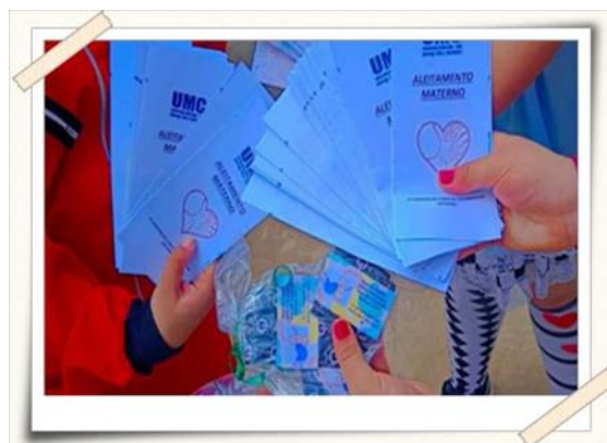
Folheto e kits desenvolvido pelos alunos