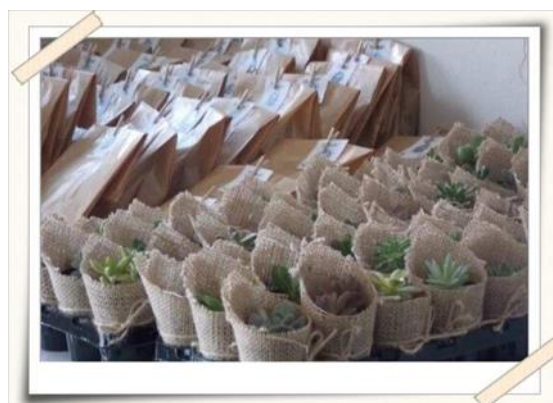
Registro dos kits distribuídos no evento