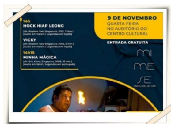
Cartazes de Divulgação do Mimese #84