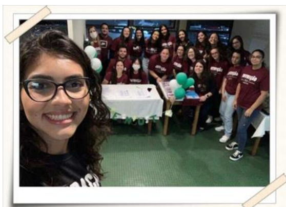
Registro da equipe organizadora