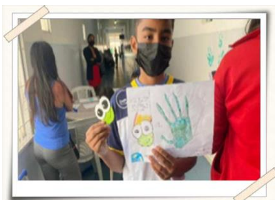
Registro da atividade desenvolvida pelo aluno da escola municipal