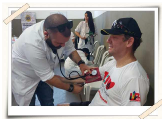
Registro dos alunos aferindo a pressão arterial – Parque da cidade