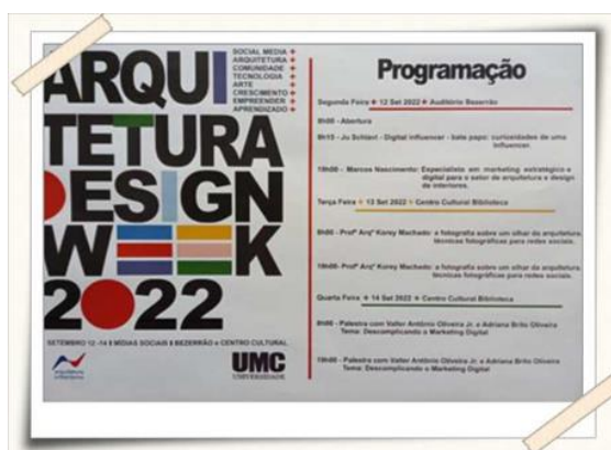
Cartaz de divulgação da jornada – Arquitetura Design Week