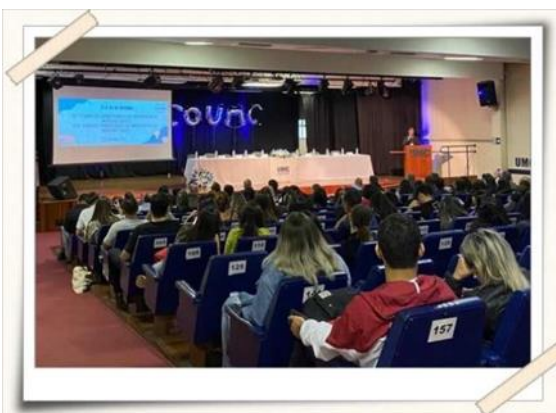
Registro do evento – Teatro UMC