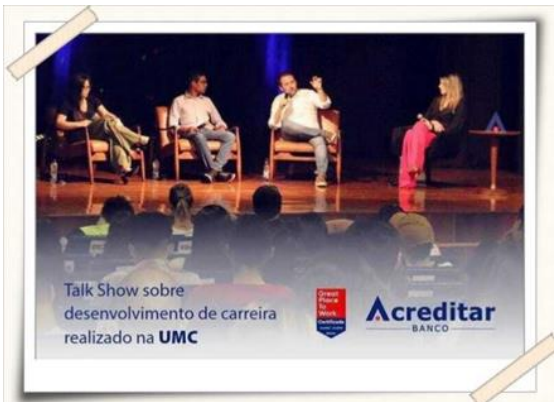
Registro do evento – Teatro UMC

O evento abordou ainda temas, como: o Perfil Comportamental, Empreendedorismo como Opção de Carreira, Autoconhecimento, Missão de Vida e Carreira, Imagem Profissional nas Redes Sociais, Planejamento Estratégico entre outras.