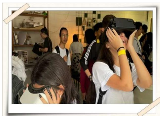
Registro dos alunos das escolas municipais com os óculos de realidade aumentada – laboratório de arquitetura e urbanismo.

Descrição: Entre os dias 31/10 a 04/11, a UMC promoveu uma nova edição do Conexão UMC, com objetivo de propiciar aos alunos de escolas públicas e privadas do ensino médio, das cidades de Suzano, Mogi e Itaquaquecetuba, a possibilidade de conhecer os laboratórios, salas de aula e um pouco mais do ambiente de graduação da UMC, vivenciando na prática o estudo da profissão desejada.