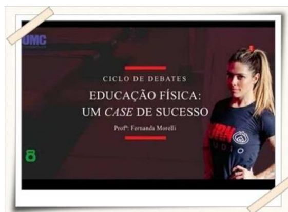
Cartazes de divulgação do ciclo de debates