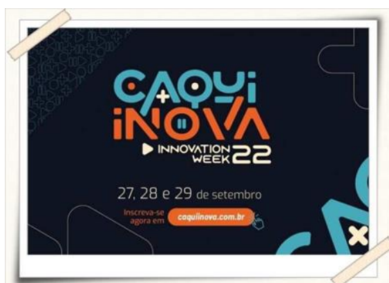
Cartazes de divulgação do evento Caqui Inova

Foram 03 Dias de experiências com foco em tecnologia, dados e empreendedorismo através de Painéis, Workshops, Mentorias, Café com Startups, Robôs, Drones, Impressão 3D, Exposição de trabalhos acadêmicos, Sala da indústria e muito mais.