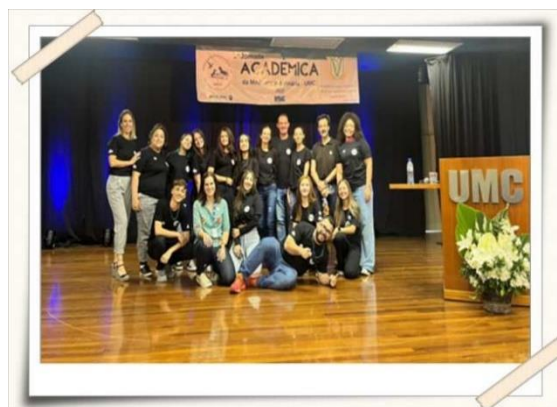
Registro da equipe organizadora