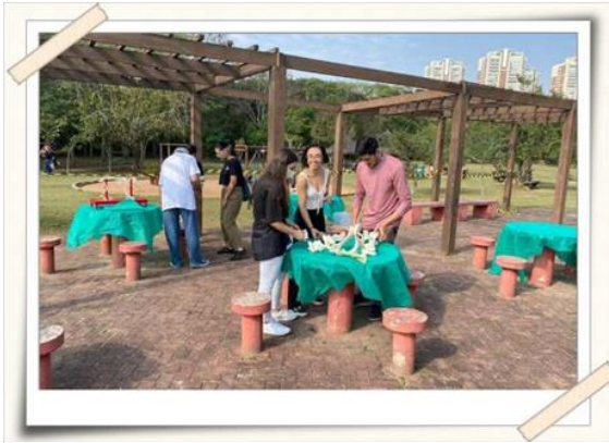
Registro da preparação do espaço – parque centenário