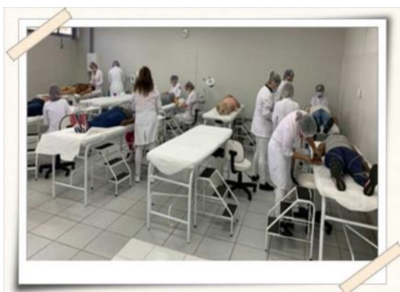
Registro dos alunos realizando o tratamento – Laboratório de Estética UMC

Os procedimentos realizados pelas alunas foram: Hidratação facial, maquiagem, hidratação mãos e tutorial de uso de lenços.