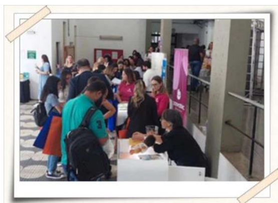
Registro do espaço dos patrocinadores