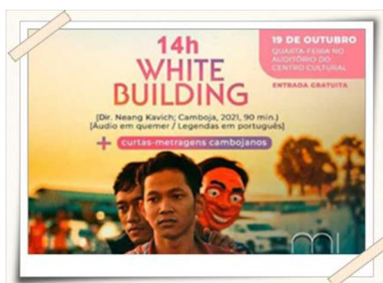
Cartazes de divulgação do Mimese #83