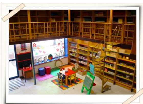
Registro da brinquedoteca pronta