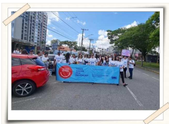
Registro da caminhada – av. doutor cândido xavier de almeida e souza

Nessa edição do evento os alunos de odontologia ganharam a companhia dos alunos do curso de medicina veterinária, que contribuíram com informações sobre os problemas orais em cães. O principal objetivo da caminhada, de acordo com a coordenação do curso, é conscientizar a população sobre o câncer de boca, uma doença relativamente comum no Brasil e que é diagnosticada tardiamente na maioria dos casos, muitas vezes, devido ao desconhecimento das suas manifestações iniciais.