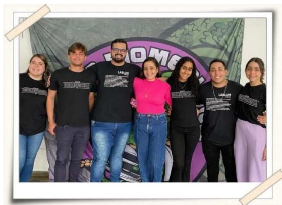
Registro da equipe organizadora

Papel do Biomédico estética, Imunologia viral, Tipos de cirurgias e estratégias de perfusão, Infecções sexualmente transmissíveis (ISTs), os princípios da gestão da qualidade, Perícia Criminal, Humanização da biomedicina e me formei, e agora?