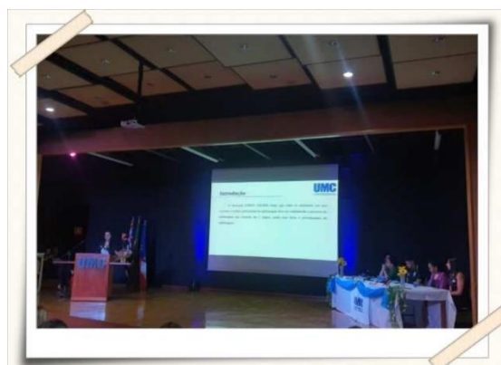
Registro do simpósio de enfermagem – Anfiteatro UMC

Descrição: Simpósio de Enfermagem: O empreendedorismo e suas possibilidades na Enfermagem. O evento foi organizado pelo 8º período do curso de Enfermagem com orientação do professor Márcio Antônio Assis, e teve como o objetivo a orientação profissional. Foram abordados os seguintes temas: A enfermagem na prática da acupuntura: uma história de empreendedorismo de sucesso; a estética e suas variáveis para empreender como enfermeira e ter satisfação na vida Enfermagem Obstétrica e a inserção de práticas variadas no cuidado com a gestante e o bebê: o caminho para o sucesso de quem empreende.