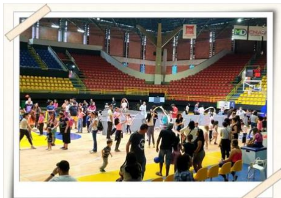
Registro dos alunos – ação ginásio municipal