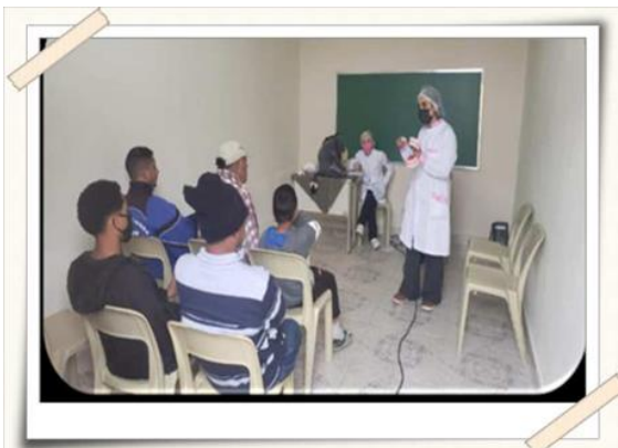
Registro dos alunos - palestra sobre higiene bucal

Descrição: A liga de prevenção bucal do Curso de Odontologia da UMC realizou avaliação bucal na população, orientação de higiene e verificação de sinais vitais (pressão arterial e glicemia). Os pacientes que necessitaram de tratamento, foram encaminhados às clínicas odontológicas do Curso de Odontologia da UMC (de acordo com a disponibilidade de vagas). A ação ocorreu na igreja Batista, no bairro da Vila Natal, na cidade de Mogi das Cruzes. Os alunos participaram ativamente da ação, com supervisão dos professores do curso de Odontologia, da UMC. O evento contou com o apoio da empresa Prever que disponibilizou um Odontomóvel.