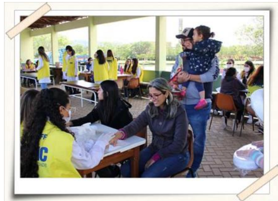
Registro da atividade – Parque Centenário