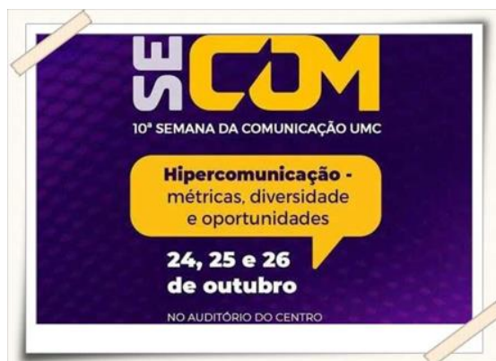
Cartazes de divulgação da 10ª semana da Comunicação