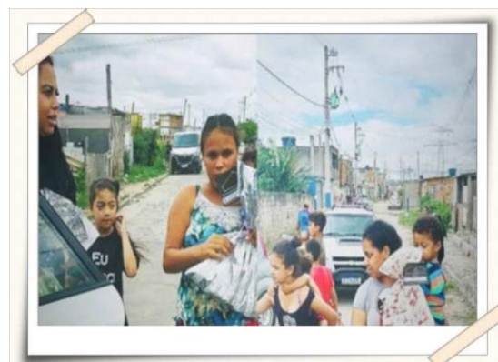
Registro da entrega dos kits - Jundiapéba