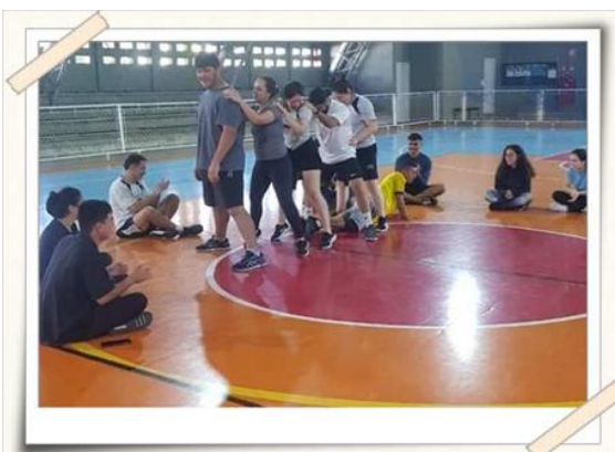
Registro da atividade prática – centro esportivo UMC