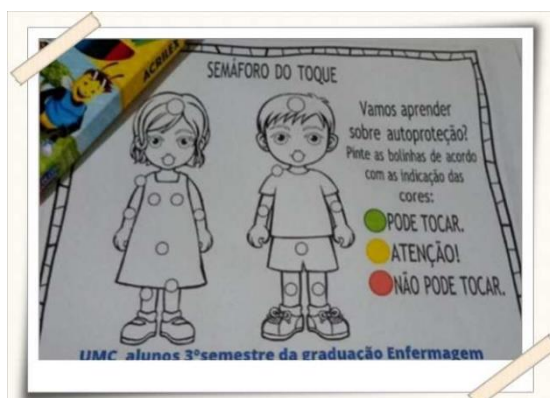
Folheto desenvolvido pelos alunos – Semáforo do toque

Além da orientação, foram entregues panetones e brinquedos as crianças e adolescentes.