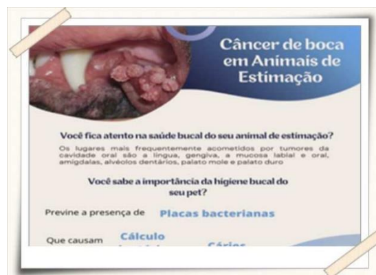
Folheto desenvolvido pelos alunos

Descrição: Os alunos do curso de Medicina Veterinária realizaram a organização/produção da 2ª campanha de arrecadação e orientação, nas seguintes demandas: visitas técnicas e seleção das ONGs a serem contempladas, controle de frequência, criação e produção de cartaz, caixas de arrecadações e panfletos, para as divulgações internas e externas.