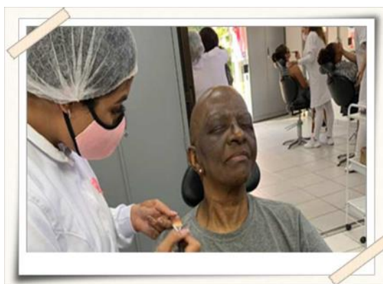
Registro dos alunos realizando o tratamento – Laboratório de Estética UMC