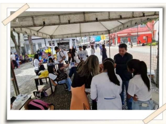
Registro das orientações e exames bucais – Praça Largo do Rosário