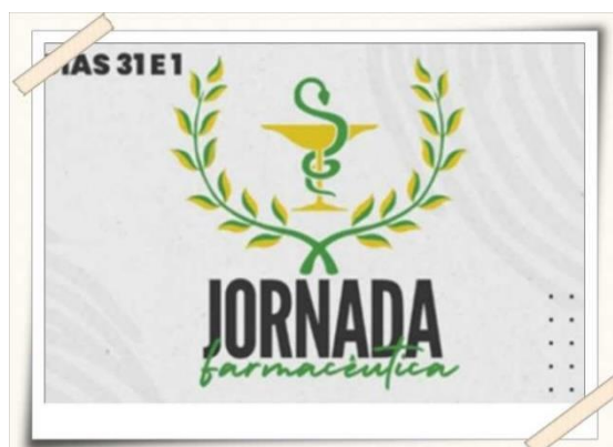
Cartaz de divulgação da Jornada Farmacêutica

Ressignificação do papel do Farmacêutico no Varejo. Após o evento, foram discutidos aspectos técnicos observados - percepções e motivações.