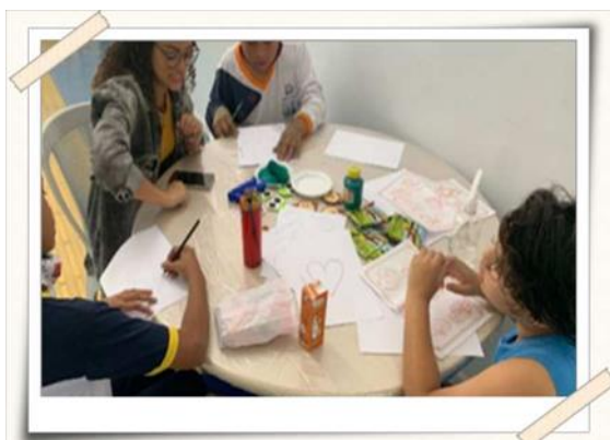
Registro do desenvolvimento da atividade

Para a diversão e interação das crianças com seus pais, foram criadas oficinas, com Música, Jogos e Brincadeiras, Desenho e pintura, Contação de Histórias, Confeção do potinho da calma, aprendendo com os números, entre outras.