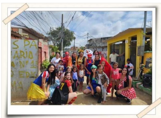
Registro dos alunos – bairro Jardim Planalto

O evento foi realizado no bairro do Jardim Planalto, na cidade de Mogi das Cruzes, onde foram atendidas, aproximadamente, 1.000 pessoas – entre crianças, adolescentes e seus pais ou responsáveis.