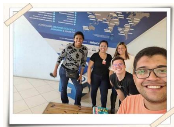
Registro dos alunos – visita técnica: SuzanLog Logística