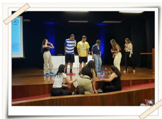
Registro dos alunos realizando uma dinâmica – Teatro UMC