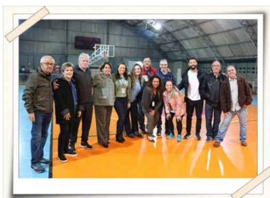
Registro dos professores e profissionais da área – Centro esportivo UMC

Descrição: Atividade acadêmica que visou discutir temas contemporâneos interdisciplinares, atinentes às questões de trabalho e mercado de trabalho do profissional de Educação Física. Buscando apropriar o discente sobre as particularidades do exercício profissional, o evento foi disponibilizado pela coordenação de curso em conjunto com os docentes e convidados.